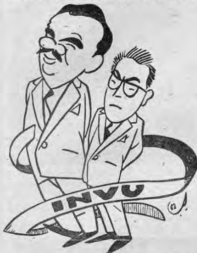
"si una vela se le apaga, otra le queda encendida"...